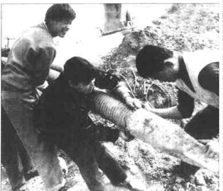
广饶县丁庄镇针对久旱无雨，采取压麦、划耩等措施保墒、提温；实际，采取措施搞小麦抗旱保墒。一方面调动人力、物力，充分利用现有水源灌溉麦田。

活动督查领导小组，制定了奖惩管理暂行规定和百分考核评比办法，层层签订责任书。为确保工程质量、督促工程进度，市政局领导多次到工地指导工作，每天下午5:30在现场召开一次碰头会，及时掌握工程进度，解决工作中出现的问题，有力地推动了工程进展。(本报通讯员)