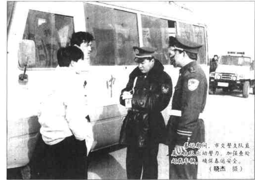
市文警支队直...